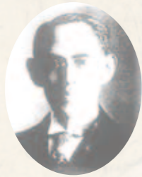
大倉和親 (おおくら かずちか)