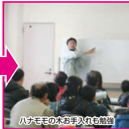
ハナモモの木お手入れも勉強