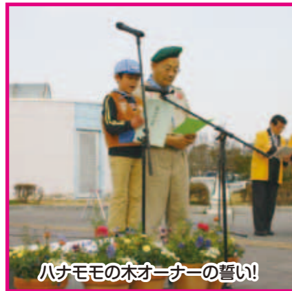
ハナモモの木オーナーの誓い!