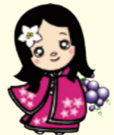
おだいちゃん 東浦町観光協会キャラクター

日時：3月15日(日) 昼の部9:00~18:00、夜の部16:00~19:40