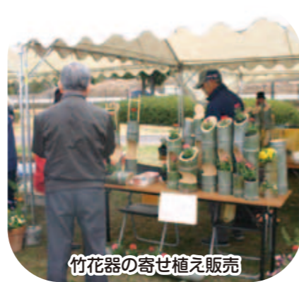
竹花器の寄せ植え販売