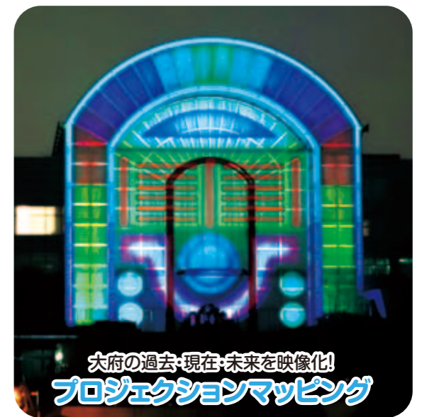
大府の過去・現在・未来を映像化! プロジェクションマッピング