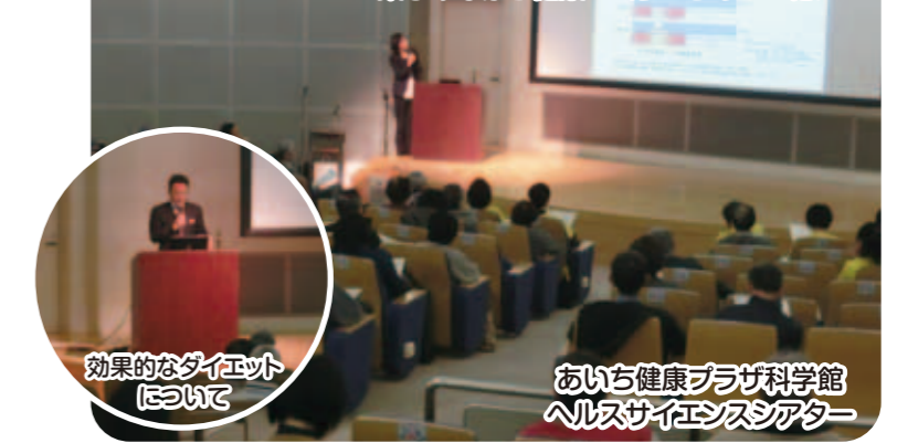
効果的なダイエット について