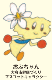
おぶちゃん 大府市健康づくり マスコットキャラクター