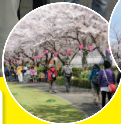
石ヶ瀬川沿いの桜