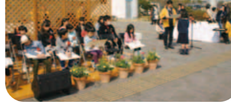
小学生ウェルネスバレー 絵画コンクール表彰式