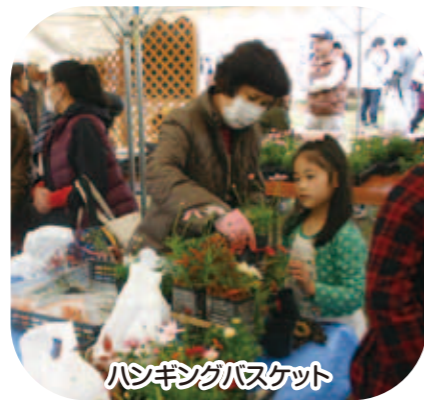
ハンギングバスケット