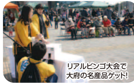
リアルビンゴ大会で 大府の名産品ゲット!