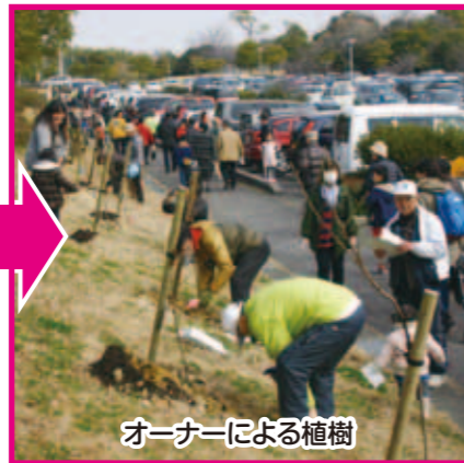
オーナーによる植樹