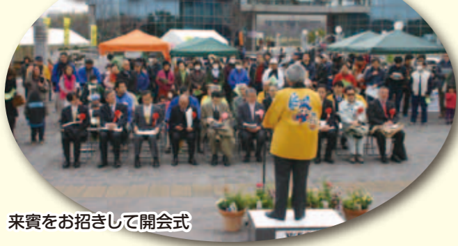
来賓をお招きして開会式

大府市と東浦町では、健康・医療・福祉・介護施設が集積しているあいち健康の森とその周辺地区をウェルネスバレーと称し、この地区において健康長寿の一大拠点の形成を目指す「ウェルネスバレー構想」を掲げています。