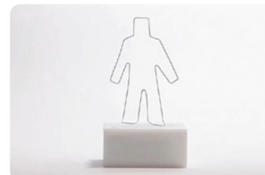
吉見製作所がスタートアップと連携し、開発した商品「ムクムクろくろく(線人間)」