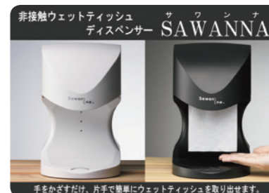
松尾製作所がスタートアップ「Field Alliance」を設立。新事業展開での商品「SAWANNA」