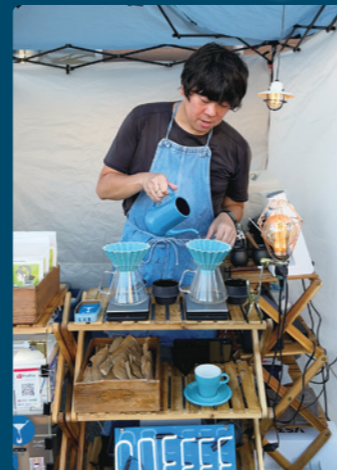
珈琲を提供する出店者