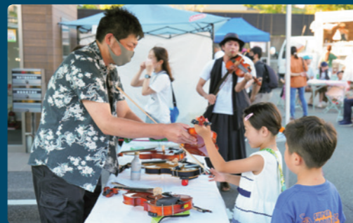
バイオリン試奏体験コーナー